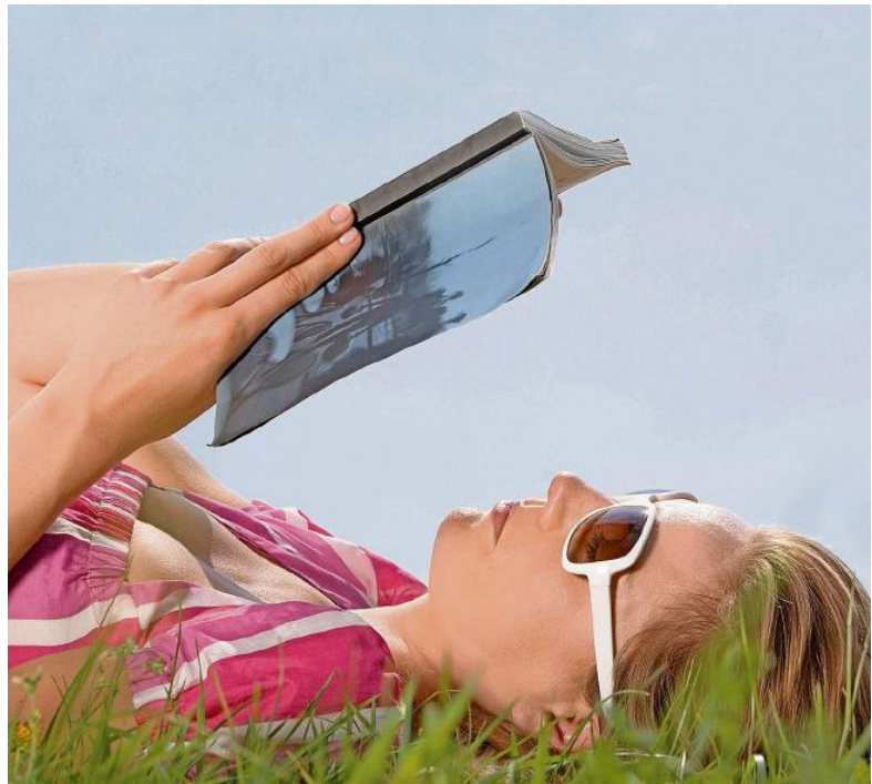
Ins Gras liegen und sich in ein Buch vertiefen: Die Sommerferien sind die beste Lesezeit im Jahr.

dio - Radio Raurach», ein Stück fesselnder regionaler Mediengeschichte. Eindrücklich, sofern der Leser in den Ferien auch europageschichtliche Tragödien erträgt, ist «Das Brüderbataillon» von Eino Hanski. Der dokumentarische Roman setzt den ingermanländischen Soldaten, die im und nach dem Zweiten Weltkrieg zwischen den Fronten gerieten, ein Denkmal. Wer leichteren Stoff mag und die Buchlektüre mit einer Tagesreise verbinden will, dem sei «James Bond und die Schweiz» empfohlen. Das Sachbuch führt den Leser mit eindrücklichen Anekdoten an Bond-Abenteurer mit Bezug zur Schweiz heran.